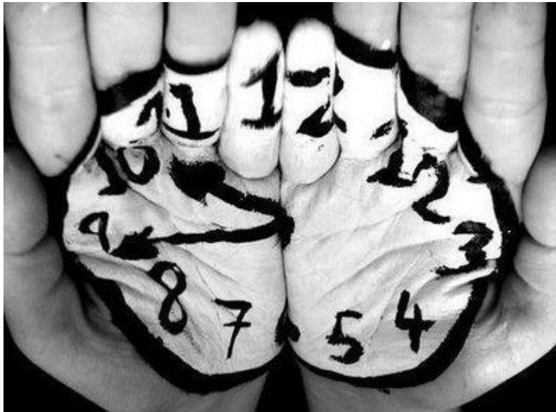
Prospero, Feliz y Grato Año 2011